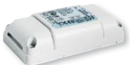
S1 LED-Treiber 350 mA / 50 mA max. 8 W

Informationen zu den Stromquellen der LED-Innenbeleuchtung von HELLA erhalten Sie in einer separaten Broschüre oder online unter www.hella.com