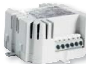
M1 LED-Treiber 350 mA / 50 mA mit max. 17,5 W