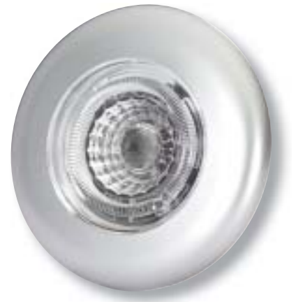
Maßstab: 1 : 1

Diese kompakte LED-Einbauleuchte vereint Ambient- und Funktionslicht in einem Spot. Ideal für Möbel- und Spotbeleuchtung. Die Lichtfarbe ist wahlweise in warmweiß (3000 K) oder in neutralweiß (4000 K) erhältlich. Die geringe Einbautiefe von 10 mm erleichtert den Einbau. Der Spot kann als Anbau- oder Einbauleuchte verbaut werden. Für die Anbauversion ist ein separater Zierring notwendig, der als Zubehör in allen fünf Farben erhältlich ist.